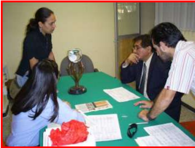
COMITÉ ORGANIZADOR REUNIDO EN EL INSTITUTO TECNOLÓGICO DE QUERÉTARO