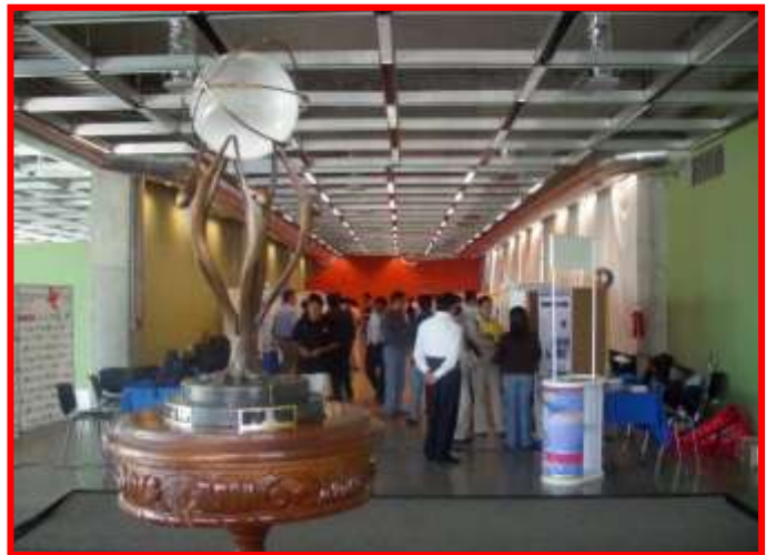
STANDS (CENTRO RECREATIVO Y CULTURAL MANUEL GOMEZ MORIN)