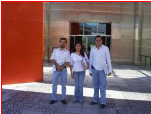
VISITA AL CENTRO CULTURAL Y RECREATIVO MANUEL GÓMEZ MORÍN