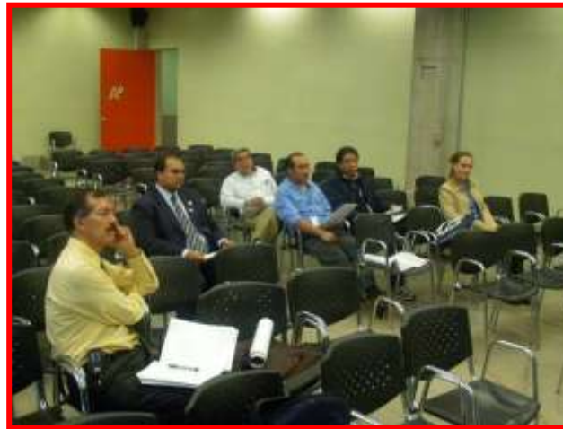
REUNION PREVIA, CON EL COMITÉ EVALUADOR.