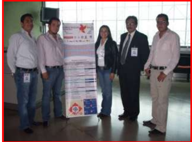
INTEGRANTES DEL STAFF Y COMITÉ ORGANIZADOR DURANTE EL EVENTO.