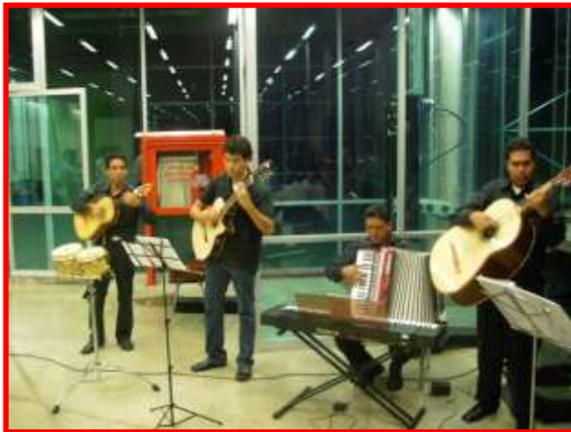
GRUPO, MEXICO, VOZ Y MAGIA, EN LA BIENVENIDA.