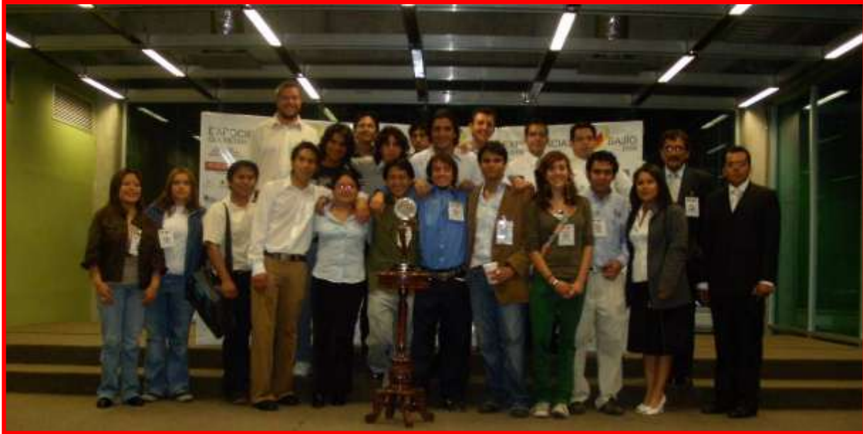
ALGUNOS PARTICIPANTES EN LA BIENVENIDA.