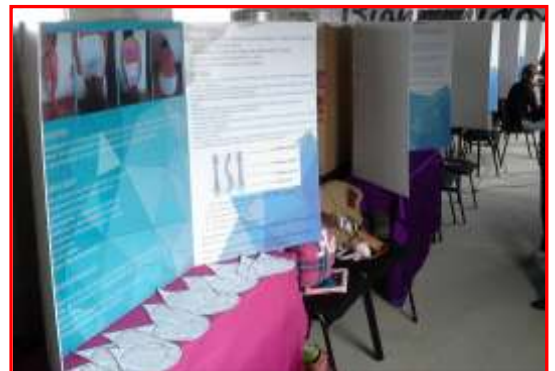
Ejemplo de mampara (s).

Es responsabilidad de cada participante traer consigo y a su cuidado, todos los materiales necesarios para la instalación y buen desempeño de su proyecto, y de esta misma forma, el equipo necesario para su exposición si así lo desea o requiere (computadoras, proyectores, prototipos, etc.)