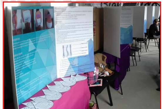
Ejemplo de mampara (s).

Es responsabilidad de cada participante traer consigo y a su cuidado, todos los materiales necesarios para la instalación y buen desempeño de su proyecto, y de esta misma forma, el equipo necesario para su exposición si así lo desea o requiere (computadoras, proyectores, prototipos, etc.)